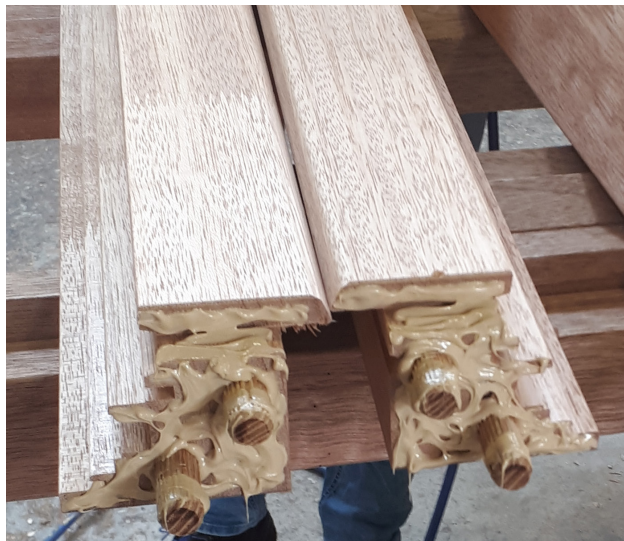
Figuur 2. Lijm streepsgewijs aanbrengen

Kozijnenlijm 0819 SLS 1-zijdig vanuit de koker, worst of machinaal streepsgewijs aanbrengen op de kopse zijde van de verbinding en een ronde ril in het gat van de deuvels. (zie figuur 2). Verder verdelen is niet nodig, dit gebeurt tijdens opsluiten.